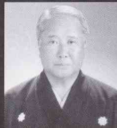
松山隆雄 (重要無形文化財保持者(総合認定))