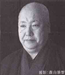
梅若実 (人間国宝、芸術院会員)